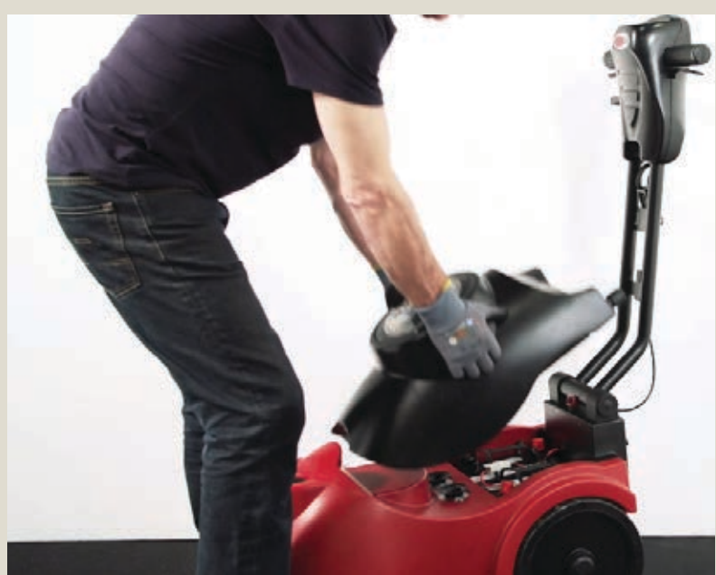
Opróżnij zbiornik nieczystości.