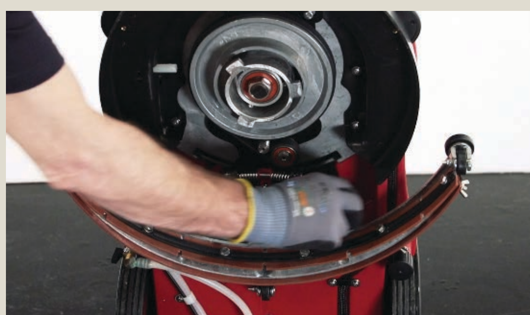
Zdejmij ssawę. Gumy ssawy sprawdź i wyczyść.