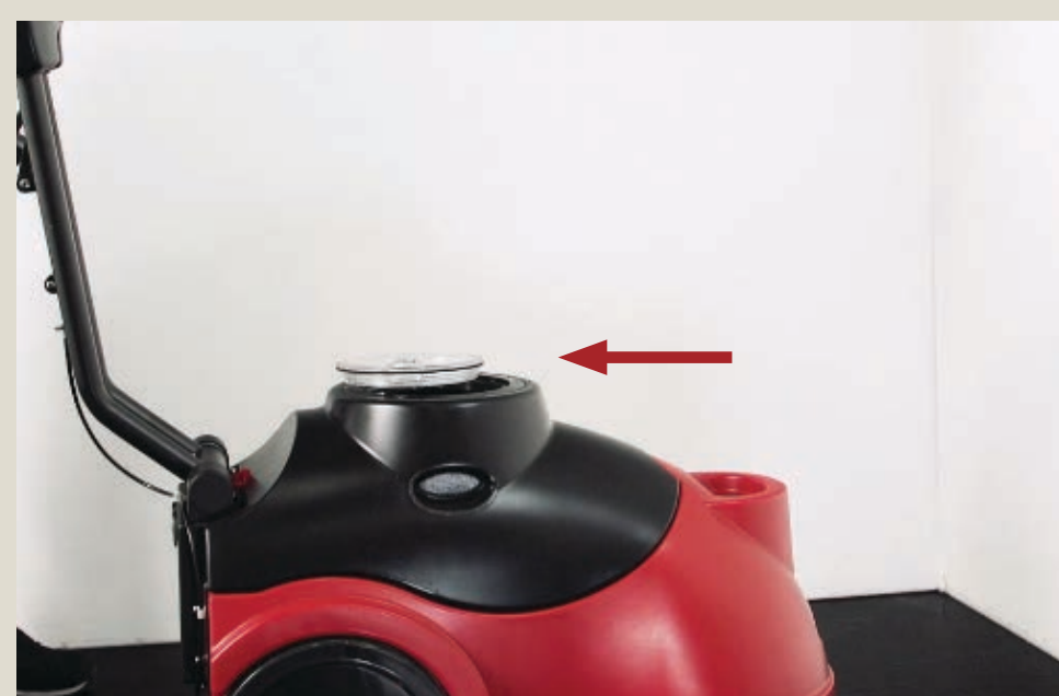
Zaparkuj urządzenie z otwartym zbiornikiem wody brudnej.