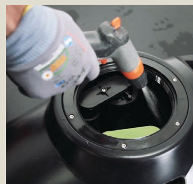
Wyczyść zbiornik nieczystości.