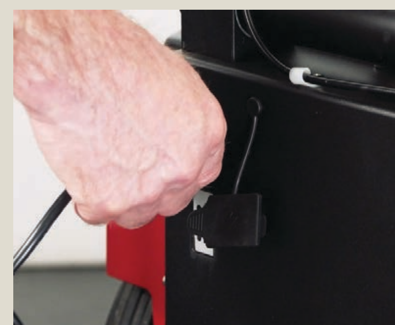
Podłącz ładowarkę akumulatora do gniazda sieciowego.

Lokalny dystrybutor urządzeń Viper: _____